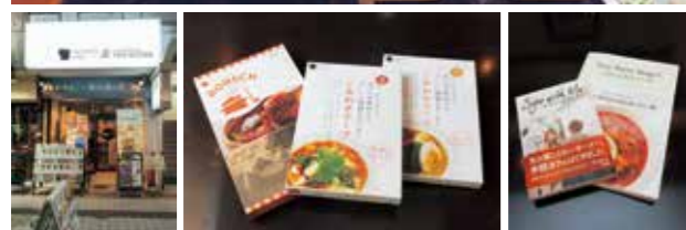
ベリーベリースープの1号店であり、本部のある長野善光寺口店。白い上着の女性2人は、山口県に新規出店する店舗の店長研修中

ベリーベリースープ全国本部 株式会社スープアンドイノベーション 〒長野市北石堂町1412-1 夏目ビル1F ☎026-223-6142(長野善光寺口店共通)